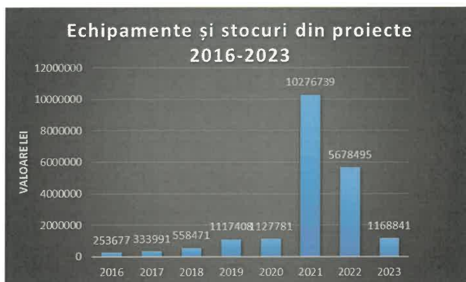
Figura 3. Echipamente și stocuri din proiecte (2016-2023)

Aprobat în Ședința Senatului Universității „1 Decembrie 1918” din Alba Iulia din 31 ianuarie 2024.